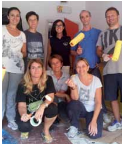
Genitori imbianchini delle scuole di Riale