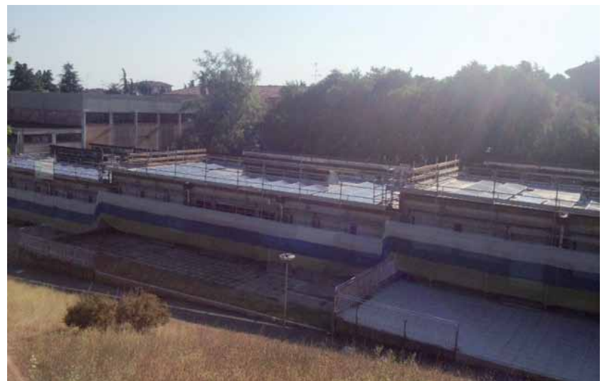
Impianto fotovoltaico alle Scuole Elementari Albergati