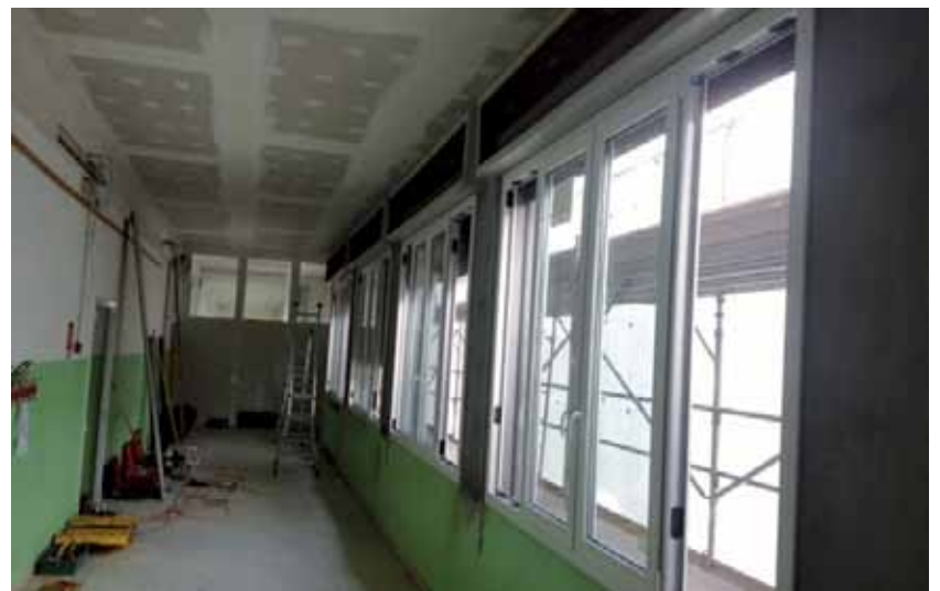
Lavori di isolamento termico e miglioramento sismico alla Scuola Materna Ponte Ronca