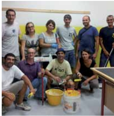
Genitori imbianchini delle scuole Albergati

tempo ed energie, L'Assessore Buccelli ha ricordato il supporto dell'Amministrazione comunale per la fornitura dei materiali, ma ha voluto ringraziare la direzione Didattica per aver messo gli "imbianchini" e gli ideatori dell'iniziativa nelle migliori condizioni per operare, in termini di orari e modalità operative.