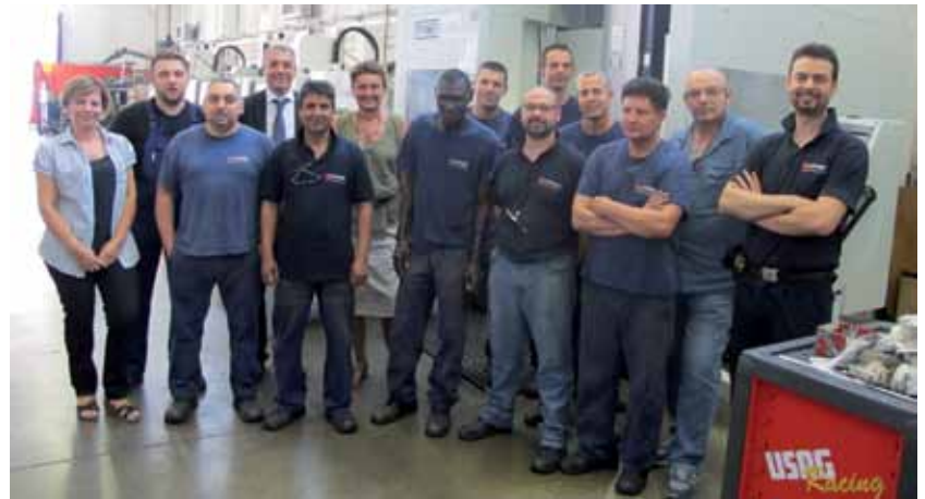
Stefano Fiorini, Sindaco di Zola Predosa, insieme ai titolari e ai lavoratori della Turrini Oreste srl

ritorio assume il termine "impresa", rappresentato da una parte da poche, grandi realtà e dall'altra da piccole o piccolissime aziende che con forte determinazione si guadagnano ogni giorno il loro spazio nel mercato globale. Con la volontà di rappresentare virtualmente tutte le realtà incontrate, pubblichiamo l'immagine che ritrae il Sindaco in visita alla Turrini Oreste srl.