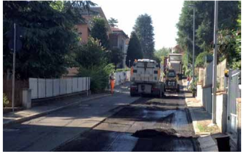
Asfaltatura in Via Foscolo

Infine, anche il sistema di pubblica illuminazione arriva a fine estate completamente rinnovato: è stata, infatti, completata la sostituzione di circa 2700 punti illuminanti con altri a risparmio energetico ai vapori di sodio ad alta pressione e a led; sono stati rifatti 40 quadri elettrici di comando con installazione di telegestione punto/punto di ogni singolo punto luce, oltre alla verifica ed ottimizzazione dei flussi luminosi e delle accensioni. Interventi, questi, che consentiranno un risparmio energetico significativo a beneficio di tutta la collettività.