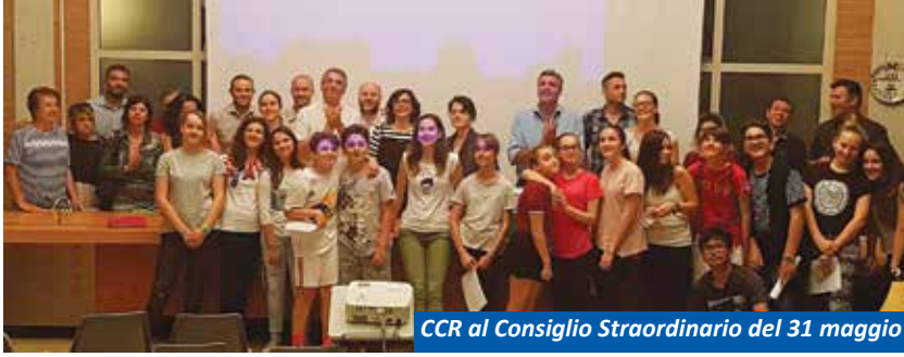
CCR al Consiglio Straordinario del 31 maggio

Attraverso gli occhi dei ragazzi del CCR