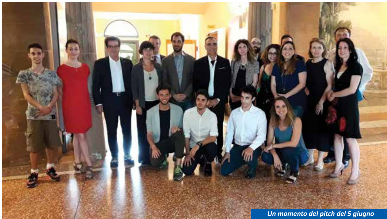
Un momento del pitch del 5 giugno

Per maggiori informazioni: www.villagaragnani.it co-start@villagaragnani.it 346.654.12.32