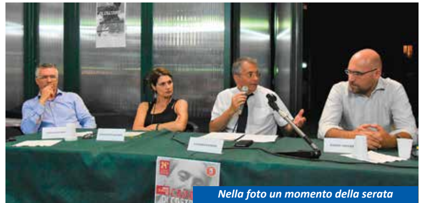
Nella foto un momento della serata

nisti e istituzioni. Oltre alle attività di indagine, le misure di contrasto alla criminalità organizzata possono essere molteplici ed esprimersi a vari livelli. Sicuramente la leva dell'istruzione è quella più importante perché è solo attraverso l'educazione alla legalità e l'istruzione che è possibile spezzare il legame tra mafia e corruzione. D'altronde proprio lo stesso Giovanni Falcone diceva che la mafia è "un fenomeno umano e come tutti i fenomeni umani ha un principio, una sua evoluzione e avrà quindi anche una fine". E' importante dunque ricordare anche i successi conseguiti in questa direzione. Tra questi sicuramente un importante capitolo è costituito dal processo Aemilia, avviato a Reggio Emilia nel 2016 e tuttora in corso, che vede alla sbarra noti esponenti della 'ndrangheta calabrese, con il centro dei propri affari nelle province di Reggio Emilia e Parma. Onorare il ricordo di questi due eroi del nostro tempo e delle scorte che insieme a loro persero la vita è un esercizio importante che ci ricorda come attraverso il senso del dovere, il coraggio, la passione e l'integrità morale e intellettuale sia possibile costruire un mondo migliore. In questo credevano Giovanni Falcone e Paolo Borsellino.