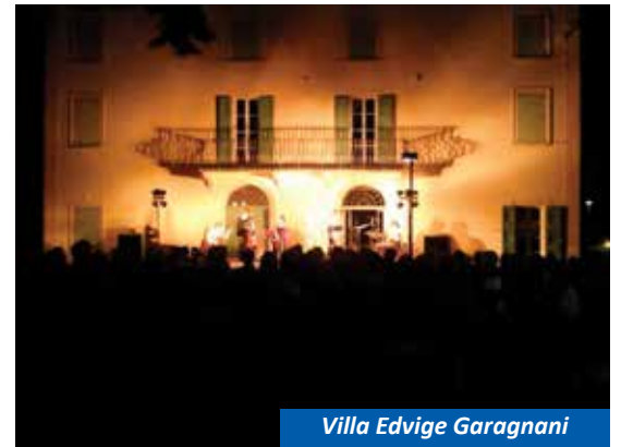
Villa Edvige Garagnani

Anche quest'anno è ricca la proposta di Corti, Chiese e Cortili, la rassegna che, da 31 anni ormai, integra la musica di alto livello alla promozione del territorio delle terre al confine tra le province di Bologna e Modena, che unisce professionisti affermati, giovani emergenti di caratura nazionale e internazionale con le realtà musicali vicine, creando circuiti virtuosi e opportunità di collaborazione tra professionisti del settore, il Conservatorio e la rete delle scuole di musica riconosciute dalla Regione Emilia Romagna.