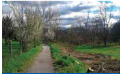
Percorso vita

E poi perché il concorso anticipa l'avvio di un più ampio percorso di crowdfunding, che ha lo scopo di finanziare alcuni interventi proprio sul Percorso Vita: stiamo parlando di un progetto di partecipazione civica finalizzato al coinvolgimento dei cittadini e al finanziamento collettivo a favore della tutela e del rilancio di un bene comune, come il Percorso Vita, attraverso l'uso di nuove tecnologie e piattaforme web. Si tratta di fare comunità e sostenere la crescita civica di Zola Predosa come luogo accogliente, dinamico e partecipato sperimentando una modalità di finanziamento dal basso innovativa ma già consolidata e attuata da altri Enti Pubblici (mi piace ricordare i 7.111 donatori che hanno permesso il restauro del Portico di S.Luca a Bologna). Obiettivo è quello di finanziare l'installazione di nuova cartellonistica e di segnalazioni indicanti i percorsi (in coerenza con la segnaletica CAI) nonché di attrezzature e postazioni che favoriscano la fruizione consapevole del percorso (storia, flora, fauna, ma anche la sua corretta fruizione in termini di regole di comportamento) e lo svolgimento di esercizi e pratiche sportive all'aria aperta.