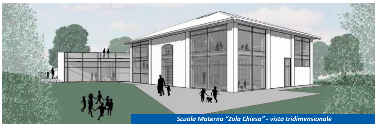
Scuola Materna "Zola Chiesa" - vista tridimensionale